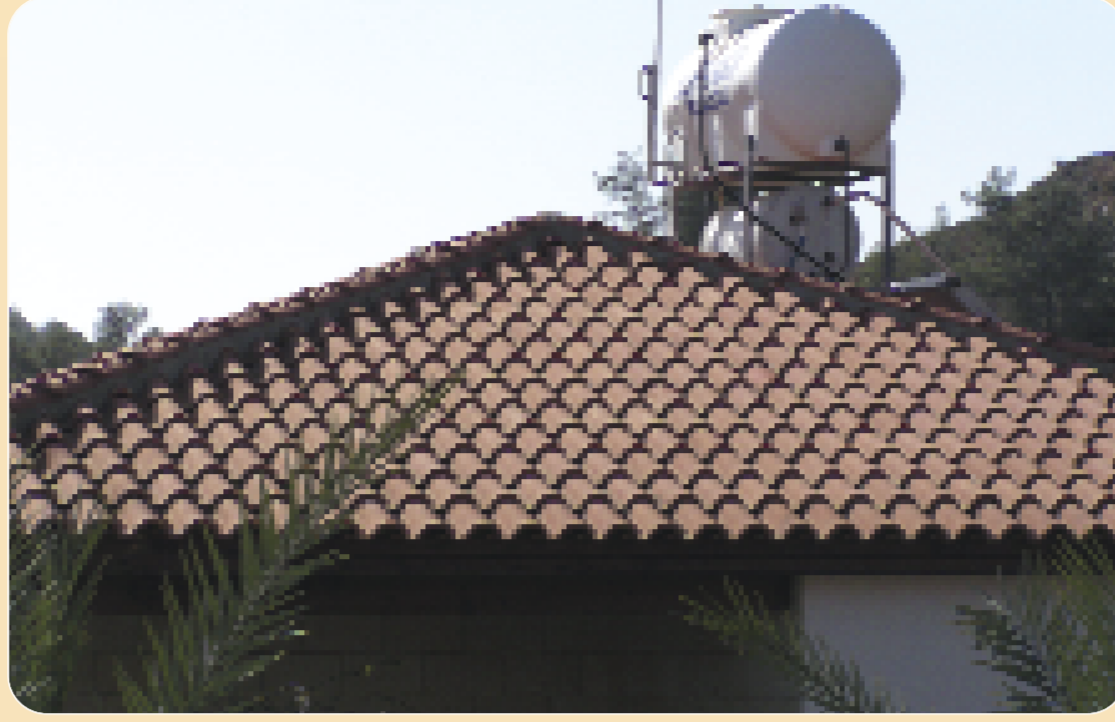
Η στέγη να είναι καλυμμένη με κεραμίδια ή άλλο μη εύφλεκτο υλικό