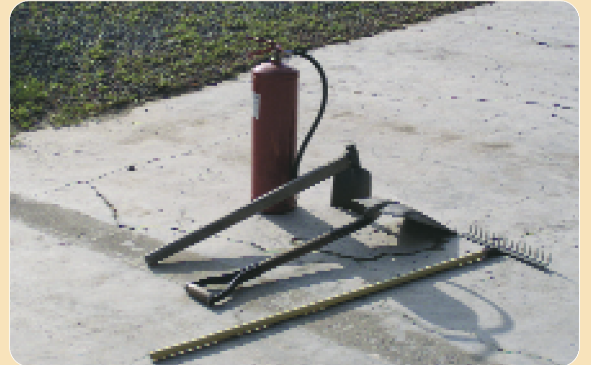
Προμηθευτείτε με κατάλληλους πυροσβεστήρες και άλλα εργαλεία πυρόσβεσης