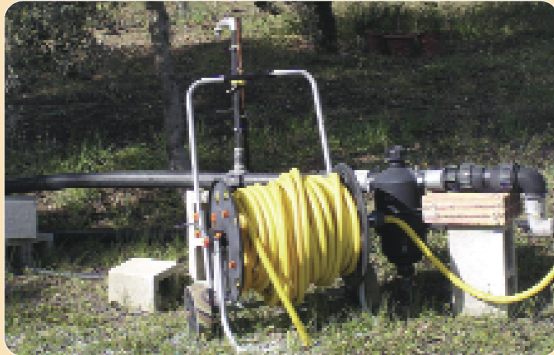
Τοποθετήστε γύρω από το σπίτι βρύσες και λάστιχα νερού