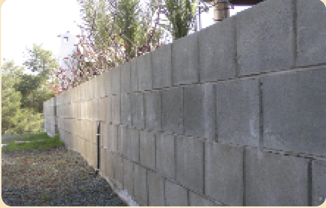
Κτίστε περιτοιχίσματα γύρω από την αυλή του σπιτιού ή τοποθετήστε μεταλλικό φράκτη