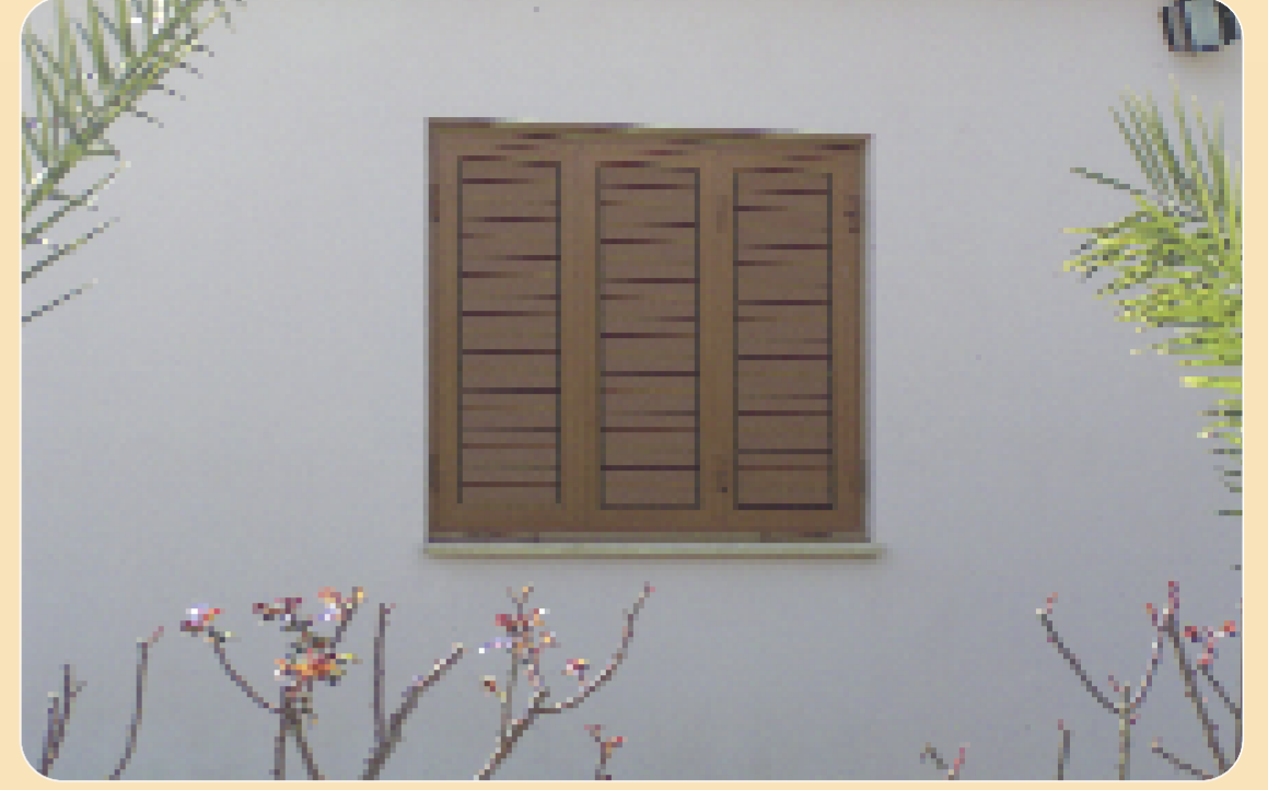
Προφυλάξτε εξωτερικά τα παράθυρα τοποθετώντας μεταλλικά πλέγματα