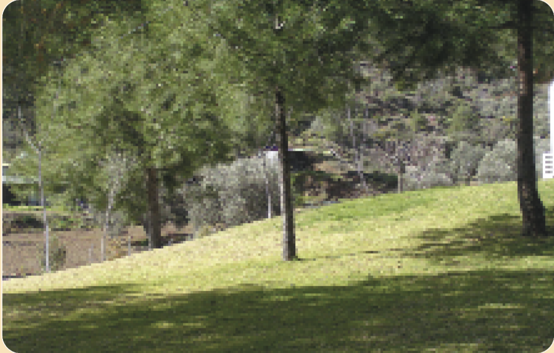
Κλαδέψτε τα δέντρα μέχρι 3 μέτρα από το έδαφος και αφαιρέστε όλα τα κλαδιά που αγγίζουν το σπίτι