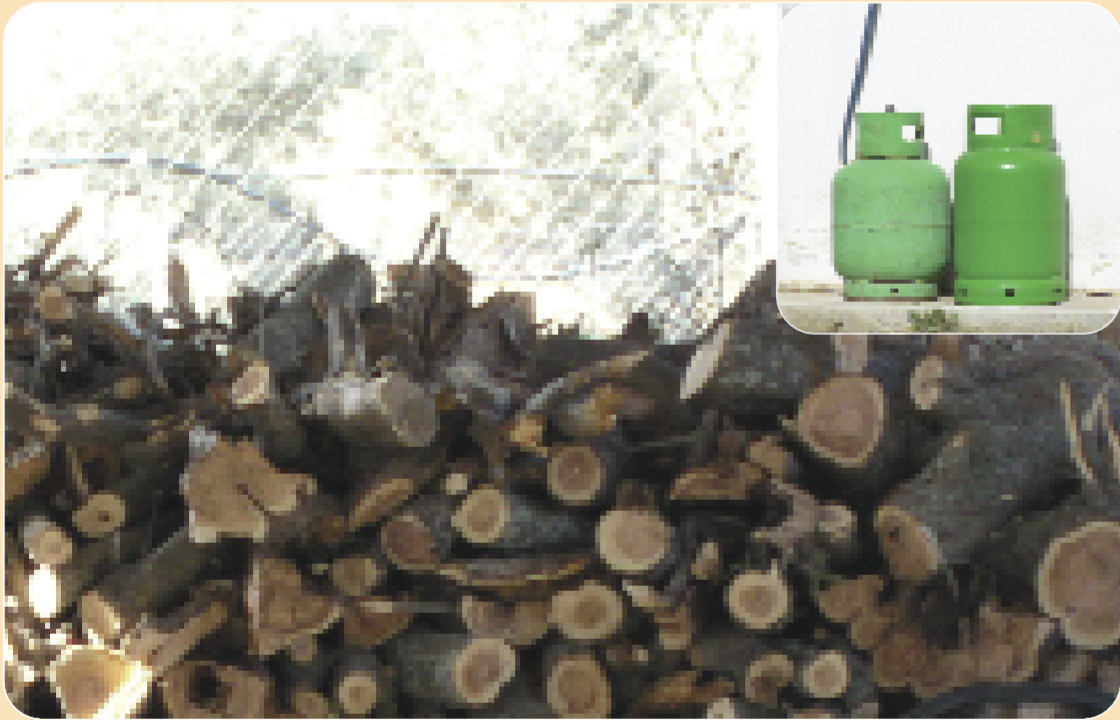
Μην αποθηκεύετε εύφλεκτα υλικά στην αυλή του σπιτιού