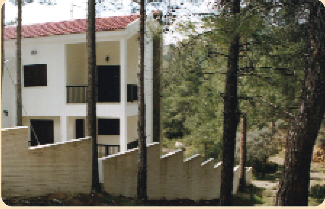
Κατασκευάστε περιμετρικά του σπιτιού αντιπυρική λωρίδα πλάτους τουλάχιστον 10 μέτρων